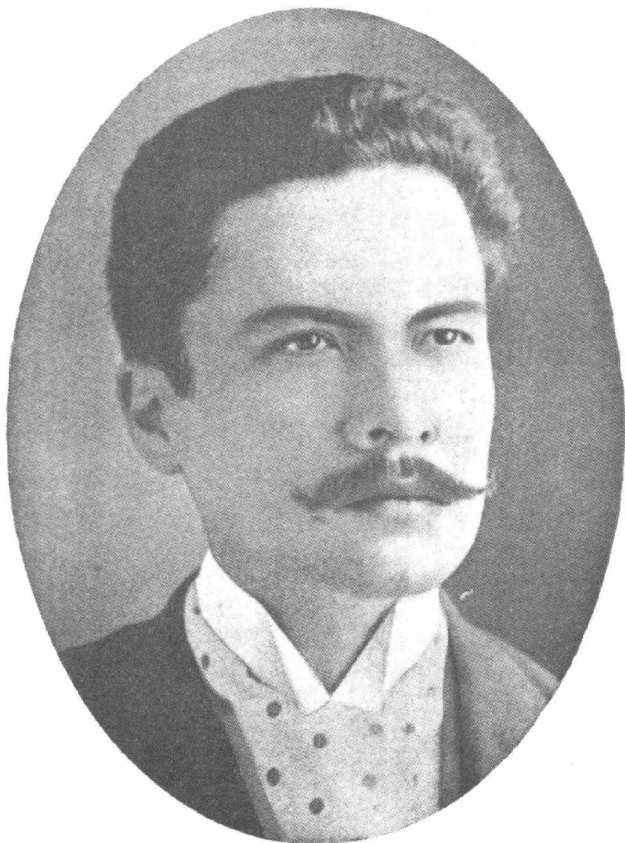
Darío en Chile (finales de 1888).